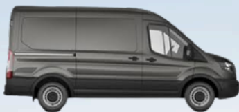
Disponible también para la versión JUMBO

L2H2 (Puerta lateral derecha – doble puerta trasera)